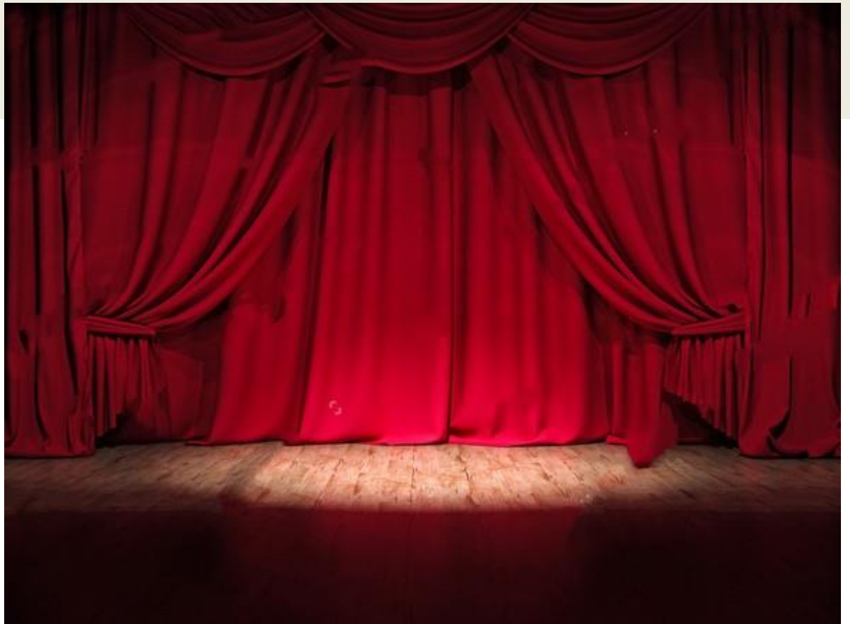
Resozialisierung durch Theater?